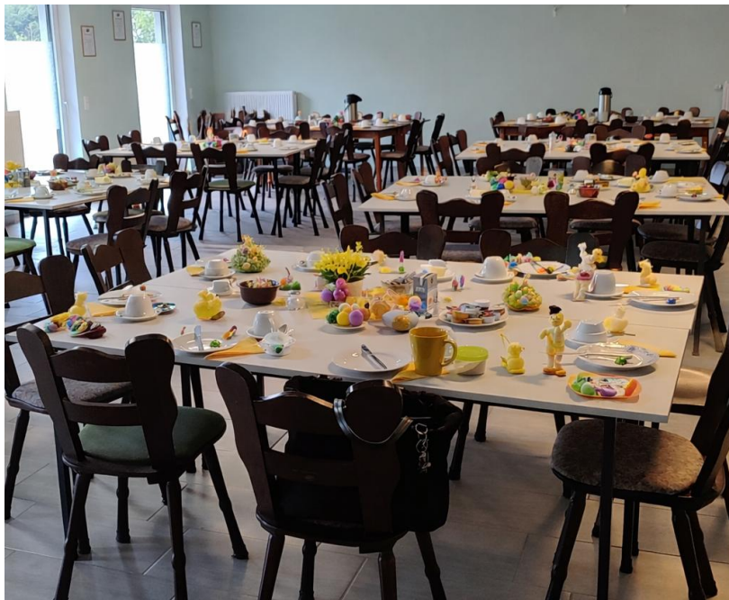
Festlich gedeckte Tische luden zum Essen ein!

Die österliche Tischdekoration samt Leckereien war verspielt und fröhlich und hieß den Frühling und die Gäste willkommen. Das Angebot fürs Osterfrühstück reichte vom